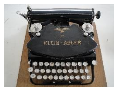
Klein Adler 1913